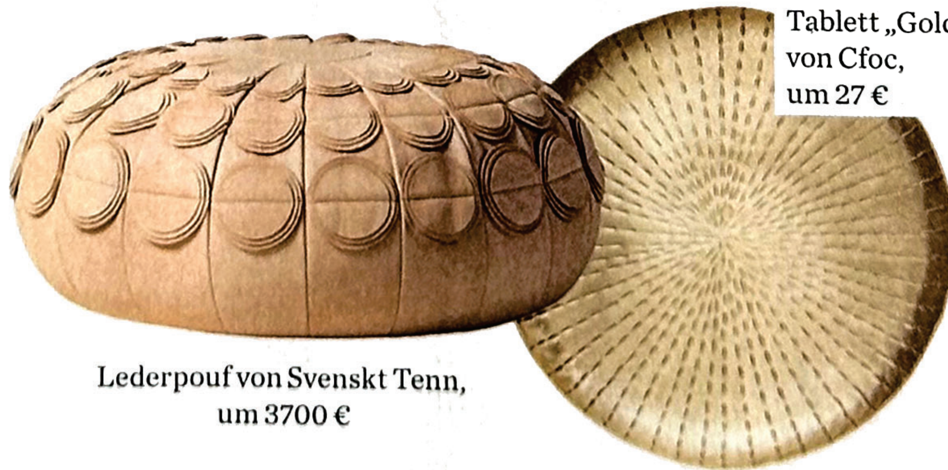
Tablett „Gold“ von Cfoc, um 27 €