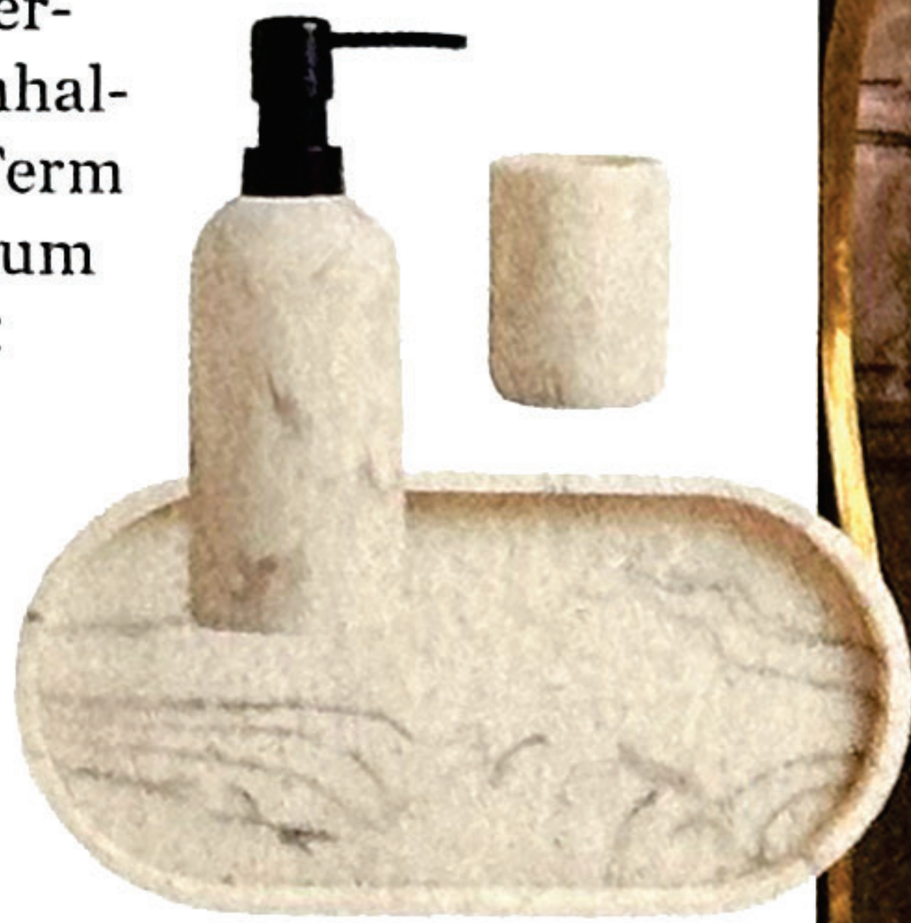
Bad-Utensilien von Zara Home, um 13 €