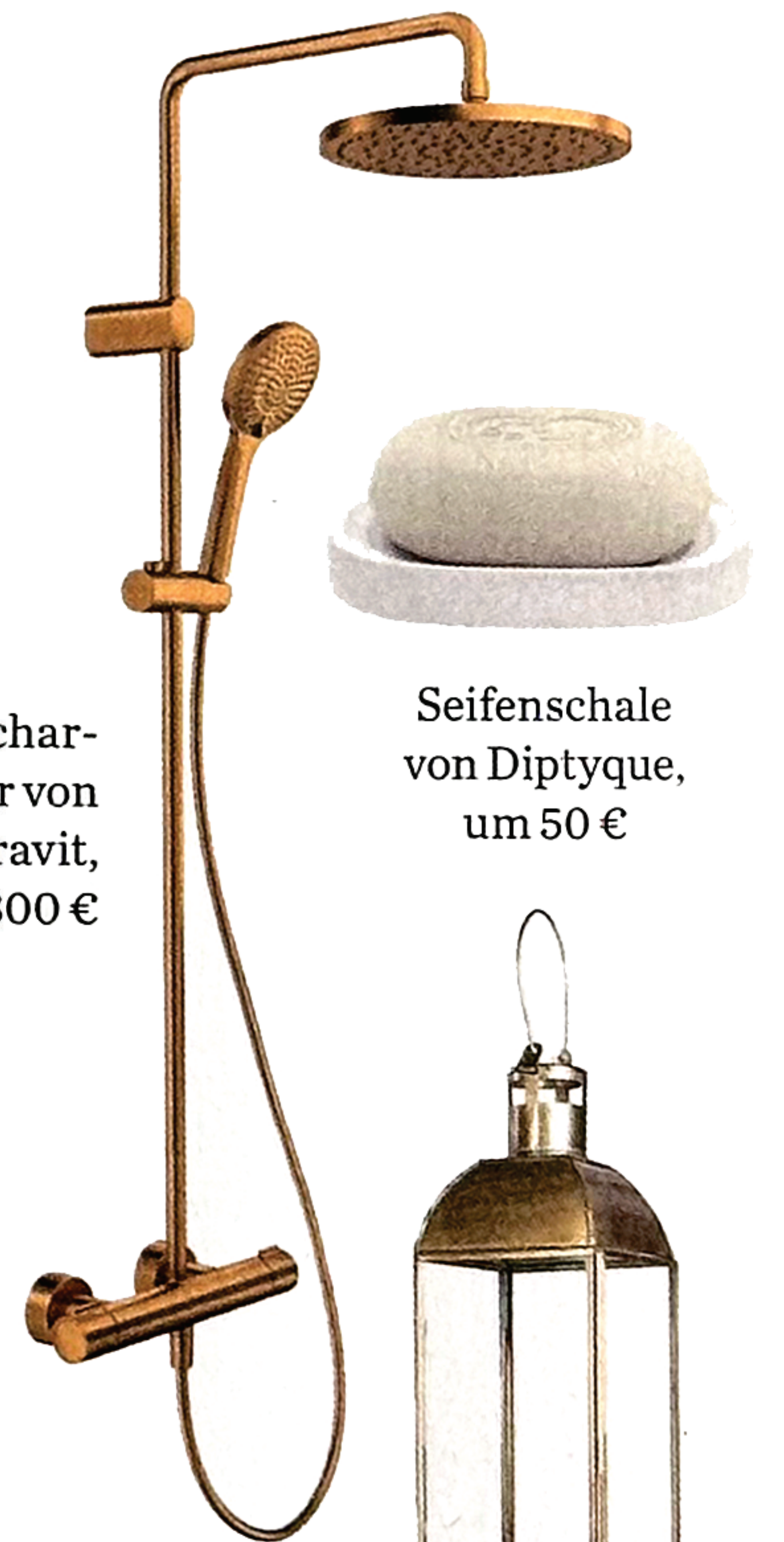
Seifenschale von Diptyque, um 50 €