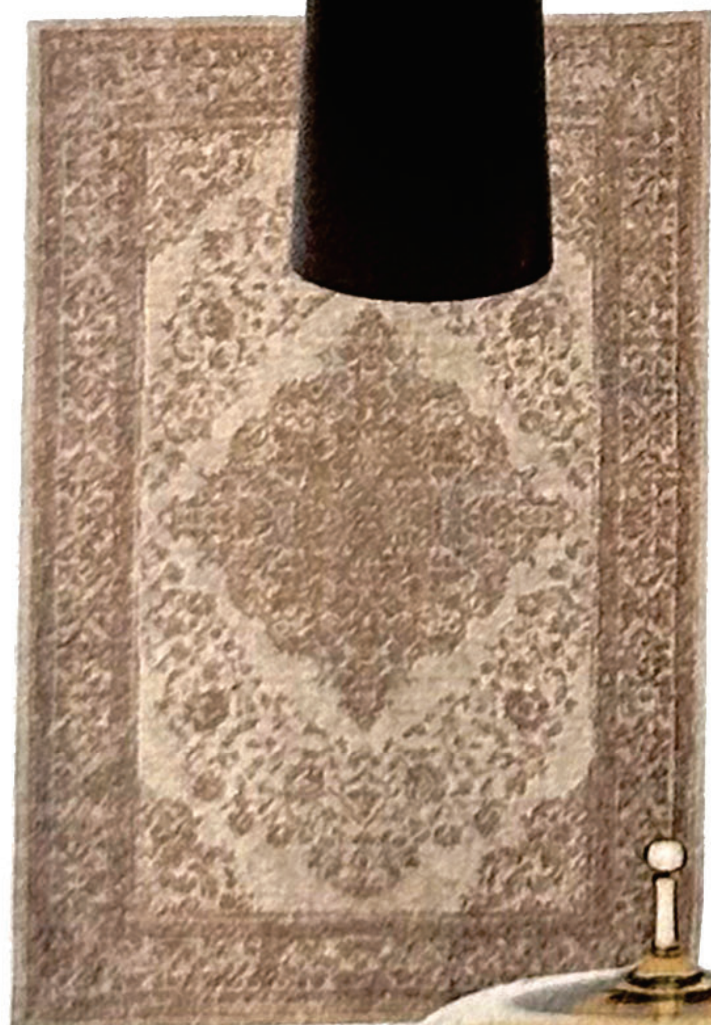
Teppich „Pearl“ von Nordal, um 360 €