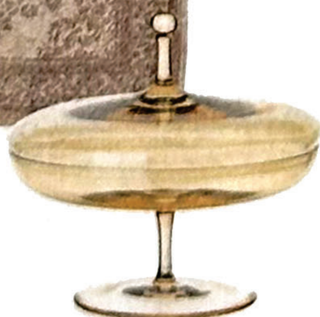
Kugeldose von Lobmeyr, um 390 €