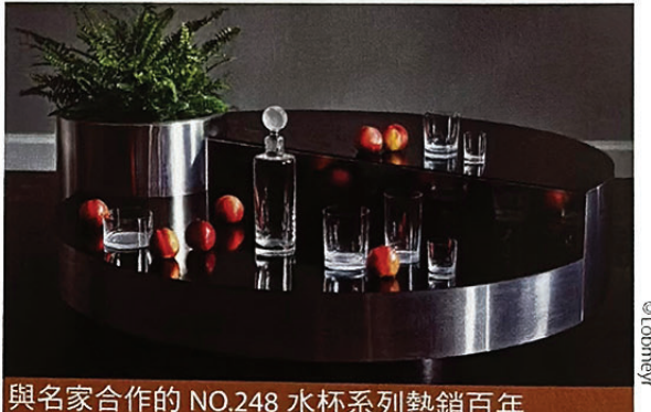
與名家合作的 NO.248 水杯系列熱銷百年

作，但這樣特別的水晶吊燈不只出現在維也納，更成為奧地利在戰後感謝美國的一份禮物。