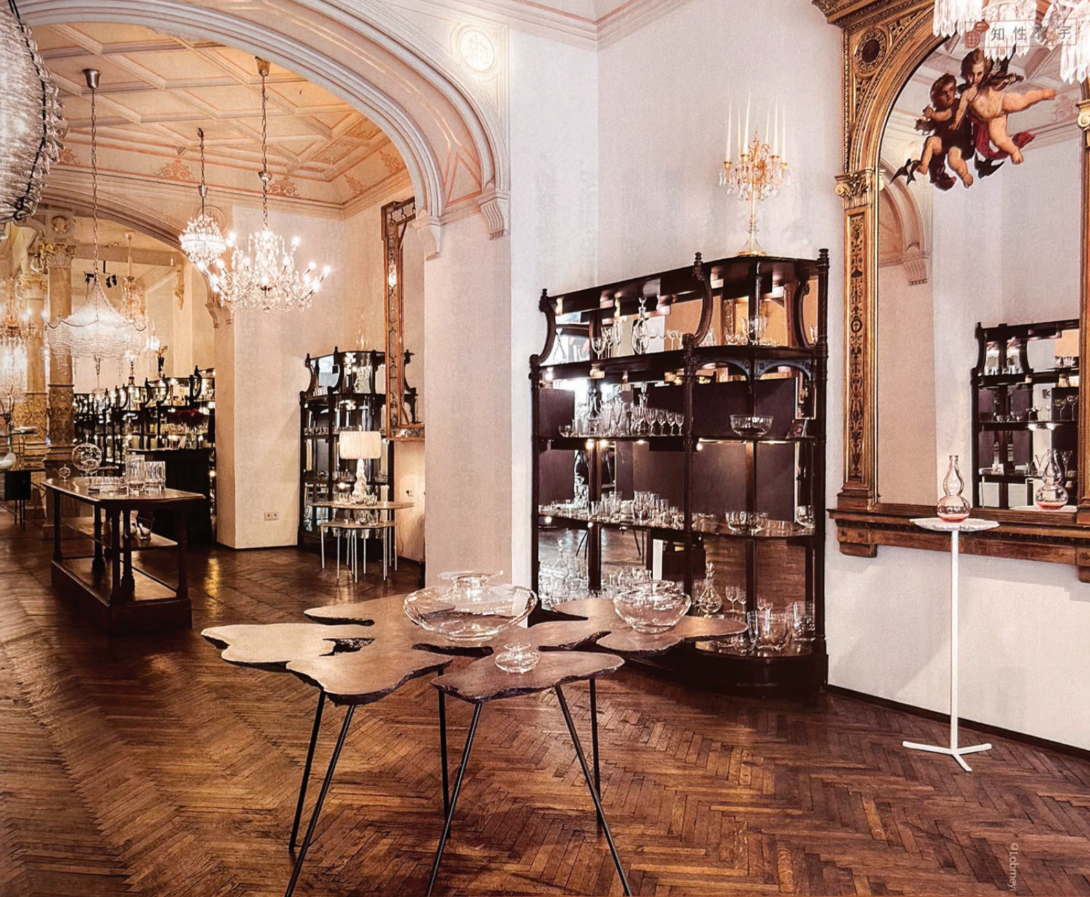
Lobmeyr 本店中呈現著精美的玻璃工藝品

嘗試這樣的合作，被認為是非常勇敢並具有革命性的創舉。維也納工坊簡單的設計在當時美感觀念中相當不合時宜，工坊的藝品風格，大大挑戰二十世紀初當道的華麗新藝術風格和舊有的奢華設計，可以想見，Lobmeyr 是冒著失去良好聲譽的風險與充滿創新的維也納工坊合作。但從今天的眼光與角度來看，這些前衛設計卻已然成為設計經典，甚至被紐約現代藝術博物館收藏。