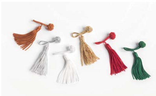
Weihnachten: 59 kupfer, 202 silber, 04 weiss 201 gold, 79 kirschrot, 22 grün