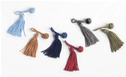
Herbst: 160 himmelblau, 60 mittelbraun, 63 purpur, 71 cerise rot, 02 dunkelgrau, 70 khaki