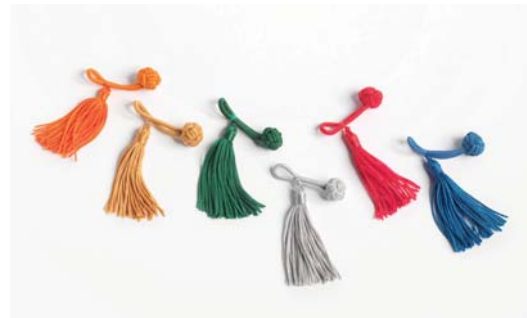
Winter: 73 orange, 55 gelblich gold, 64 meeresgrün 03 grau, 51 hochrot, 94 azurblau