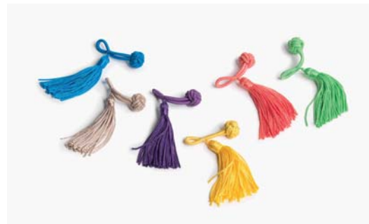
Sommer: 72 türkisblau, 34 beige, 98 lavendel 54 gelb, 89 koralle, 97 limettengrün