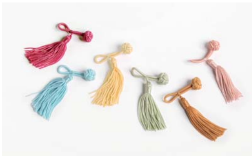
Frühling: 76 fuchsia, 16 hellblau, 91 creme, 105 lindengrün, 62 mandarine, 61 babyrosa